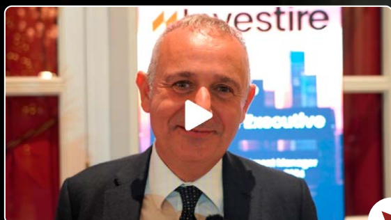
Domenico Bilotta INVESTIRE SGR